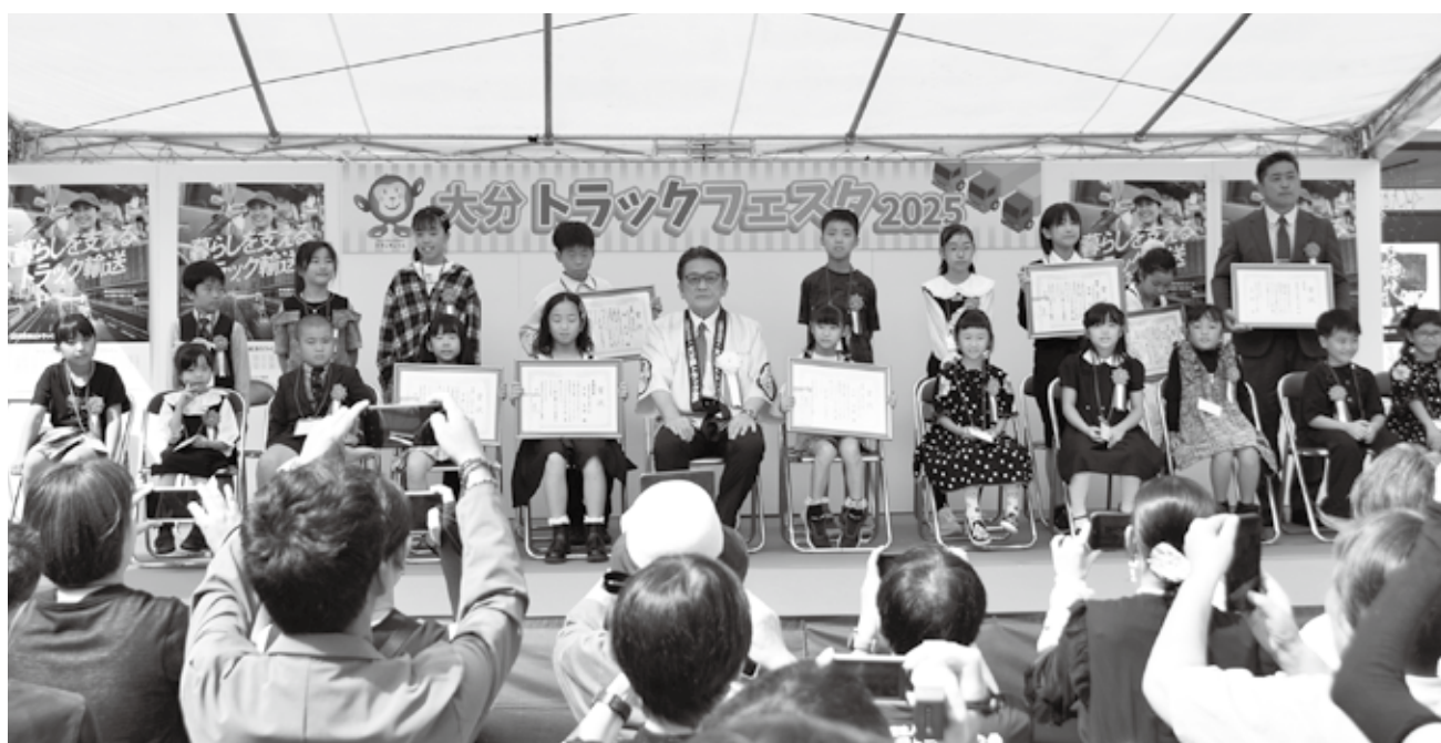
受賞者と一緒に記念撮影