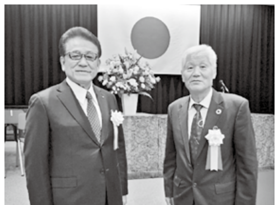
写真左から、仲会長と村本副会長