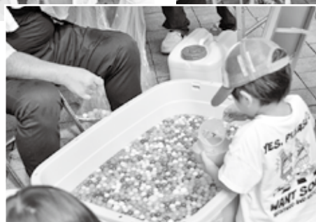
縁日ブース（綿菓子、射的、スーパースポールすくい）