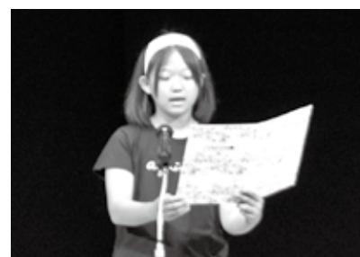
深井さんから“事故防止に関する願い”が読み上げられた

大会終了後は、大分駅上野の森口とホルトホール間の交差点において、ドライバーに安全運転を呼びかける街頭啓発活動を行なった。