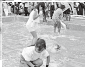
⑦魚のつかみどり 開始前の緊張感