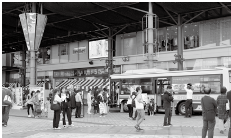
クルマのしごとフェス2025会場

大分駅前の広場で開催されたイベントは、バス・タクシー・トラック業界のブースが並び、各ブースでは実車を展示、記念撮影や記念品のプレゼントなどを行った。好天に恵まれ、駅前という立地条件も相まってイベント開始前から大勢の来場者が訪れ、各ブースや展示された車両の車内見学には人だかりや行列が出来るほどであった。