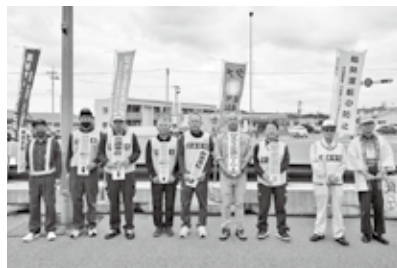
宇佐・豊後高田分会