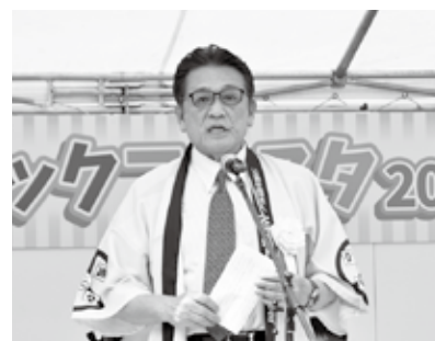
あいさつを述べる仲会長

仲会長は「26回目となった児童絵画コンクールに県下84校から327点もの作品の出演をいただいた。児童の皆さんとご理解・ご協力をいただいた学校関係者と保護者の皆様に厚く御礼申し上げます。寄せられたどの作品も「みらいのトラックゆめのトラック」のテーマに沿った、とても新鮮で想像力豊かな素晴らしいものであった。このような作品に接して、私は子供の夢がかなうような将来につながるトラック運送業界にしたいと強く感じた。皆様方には、今後ともトラック業界に対して、ご理解とご支援を賜れば幸いに感じる。このコンクールも引き続き、来年以降も実施していくので、皆様方から多くの作品を出展していただけるようお願い申し上げます。」と述べた。