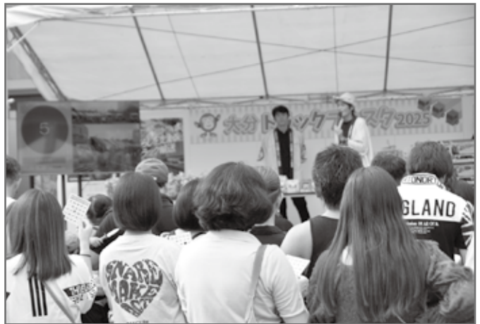
最後に大抽選会（ビンゴ大会）が行われた

本フェスタの収益金は、交通事故遺児の支援を目的に、社会福祉法人大分合同福祉事業団に寄託される。