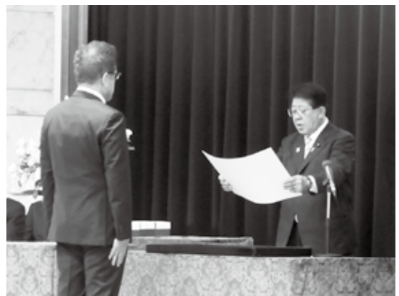
受賞者を代表して、 表彰状を授与された仲会長