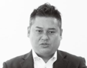
青年部魚返部会長挨拶

会議では、「大分トラックフェスタ2025収益金」、「企業物流セミナー」、「物流出前講座」、「物流視察研修」、「全ト協九州ブロック大会・全国大会」等について協議・報告がなされ、様々な意見が飛び交い充実した会議となった。