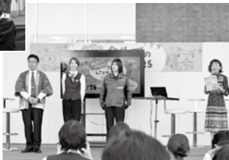
バス・タク・トラ魅力対決!