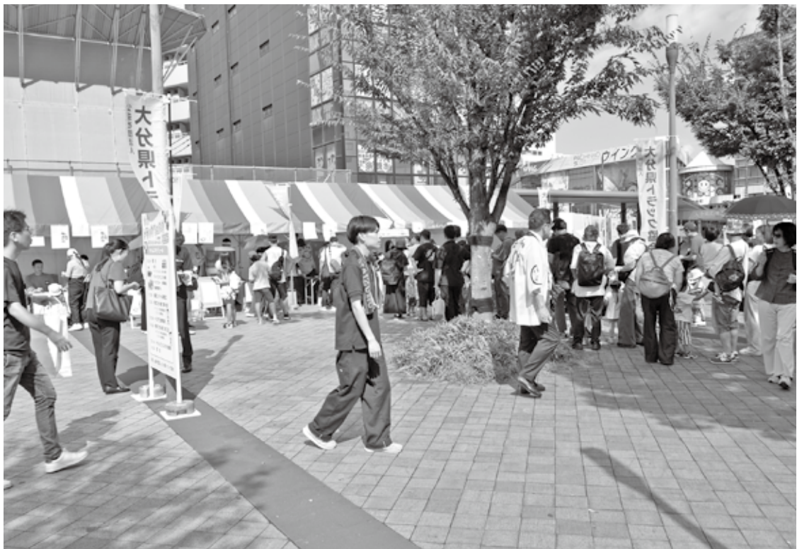
賑わうフェスタ会場