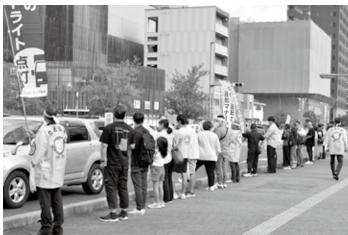
大分駅上野の森口交差点で街頭啓発活動を実施