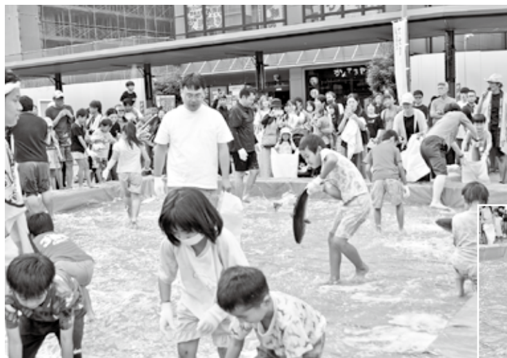
逃げる魚を懸命に追って掴まえる子供たち