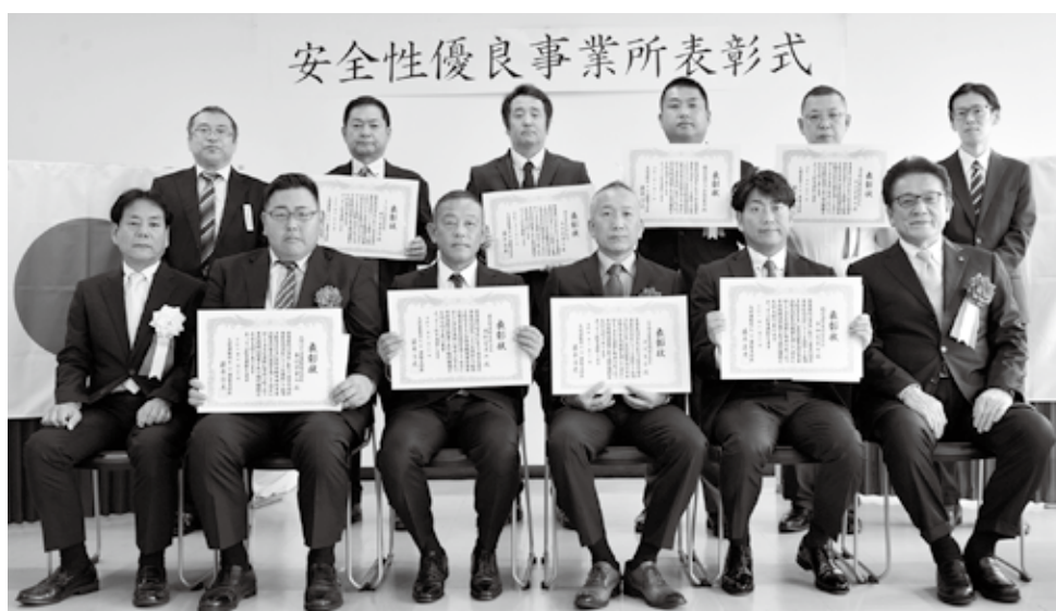
受賞者とともに記念撮影