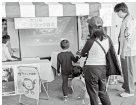
大分県トラック協会のブース