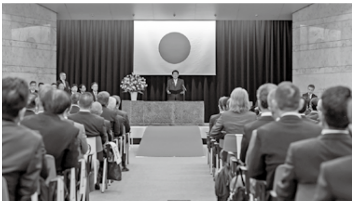
表彰式会場のようす （写真中央：金子恭之国土交通大臣）