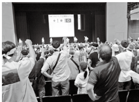
全員でシュプレヒコール