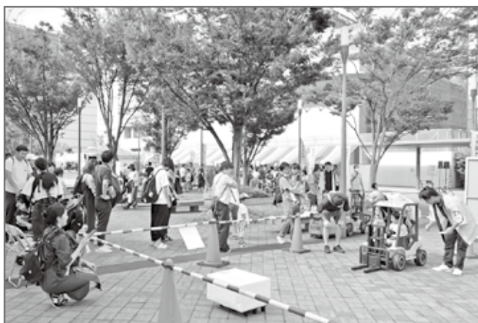
キッズフォークリフト運転体験

また、女性部会は各地の新鮮野菜による「農産物販売」、ゲーム感覚で卵や米を獲得する「たまごチャレンジ」と「お米チャレンジ」さらに「野菜詰め放題」のブースを出展。いずれのブースも長い行列ができ、