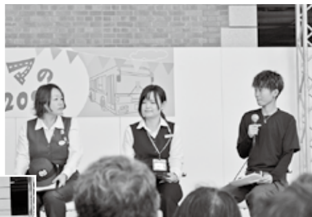
女性ドライバーによるクロストーク

また、特設ステージでは、オープニングに続いてバス・タクシー・トラックの女性ドライバーによるクロストークや、適職診断ショー「あなたはどのドライバータイプ?」、業界対抗プレゼンバトル「バス・タク・トラ魅力対決!」などが1時間ごとに順次行われた。業界対抗プレゼンバトルでは、トラックが優勝した。