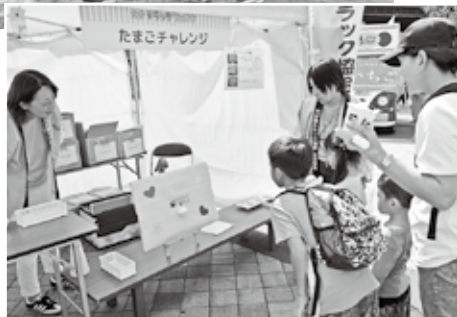
⑤農産物販売 ⑥たまごチャレンジ