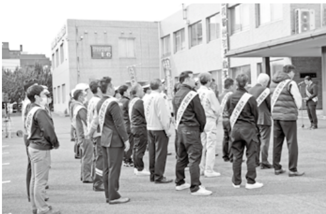
オープニングセレモニーのようす

セレモニーの後、参加者全員で隣接する大分県交通会館前に移動し、幹線道路の臨海産業道路両側で街頭啓発活動を行い、信号待ちのトラックの運転手にチラシを手渡し過積載運行防止を呼びかけた。