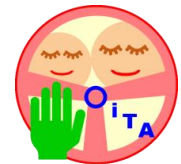
優しいマナーと思いやりの 運転県おおいたシンボルマーク