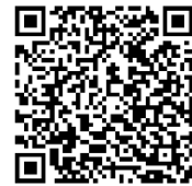
相談支援センターHP