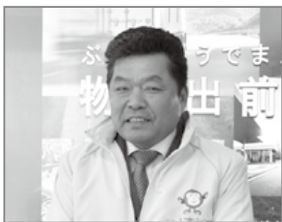
あいさつする中野支部長

最後に、トラック運送業の課題として、①環境問題への取組みについて、環境に優しい車両やアイドリングストップなどエコな