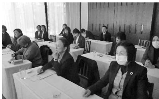
女性協議会主催研修会の様子