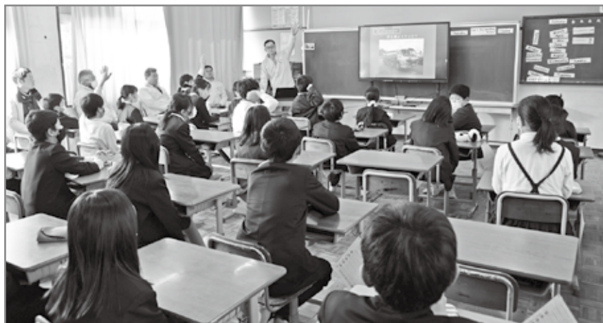
教室で行われた出前講座（座学）の様子