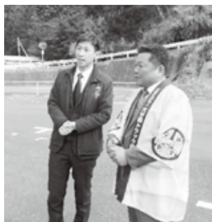
石川市長と懇談する 中野県南支部長