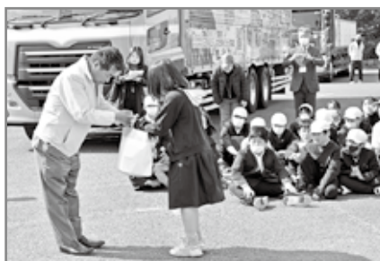
生徒に記念品が贈られた