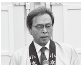
永松杵築市観光協会長