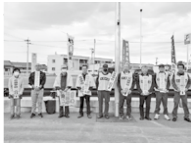
宇佐・豊後高田分会