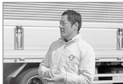
閉講の挨拶する荻本青年部会長