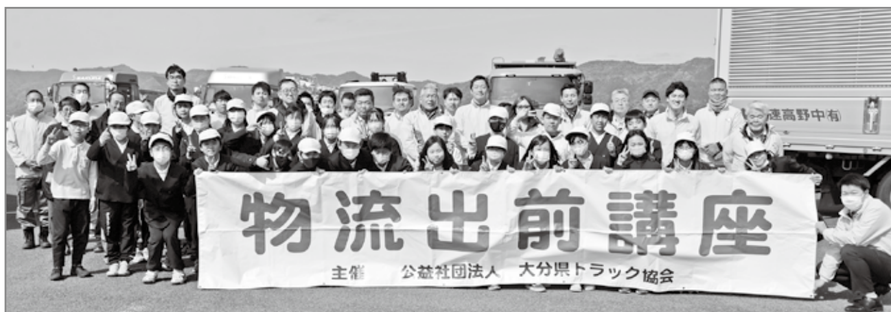
参加者全員で記念撮影