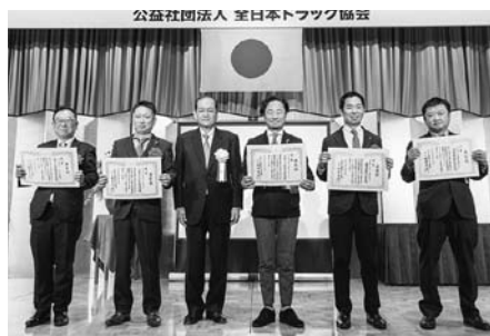
青年経営者顕彰授与式