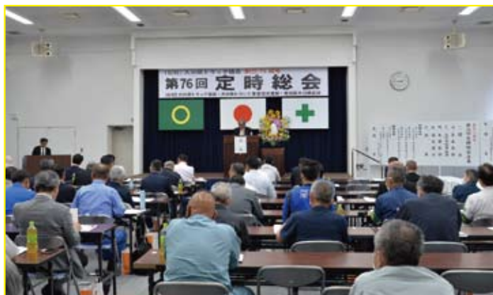
陸災防大分県支部の総会

本年度の事業計画では、重点項目に①荷役労働災害の防止②交通労働災害の防止③健康確保対策の推進を掲げ、①事業場の安全衛生水準向上の取組の推進②荷役運搬作業の安全の確保③交通労働災害の防止④健康確保対策の推進⑤安全衛生教育の徹底⑥安全衛生意識の高揚などを実施する。