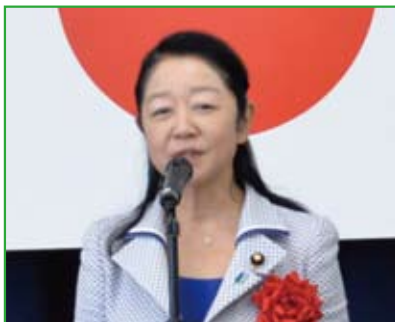
参議院議員 白坂亜紀 氏