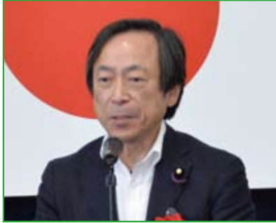
参議院議員 古庄玄知 氏

運輸関係の事業を取り巻く状況はかなり厳しい状況にあり、いわば冬の時代と言っても良い。