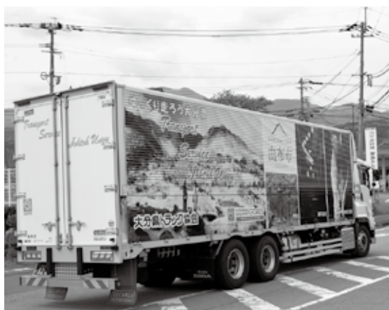
出発するラッピングトラック

ラッピングトラックの前で出席者全員で記念撮影を行ったあと、全国へ向けラッピングトラックは由布市役所を出発した。