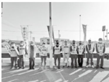
宇佐・豊後高田分会