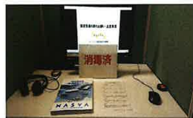
イメージ（動画視聴方式）