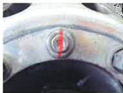
ホイール・ナットへのマーキング例