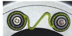
左右のホイール・ナットが緩んだ状態