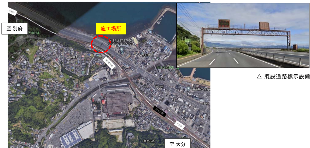
△ 既設道路標示設備