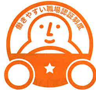
「一つ星」認証マーク

申請受付・認証業務は、国土交通省から、本制度の実施団体に選定された「一般財団法人日本海事協会（通称：ClassNK）」が行います。